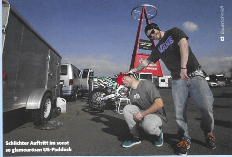
Schlichter Auftritt im sonst so glamourösen US-Paddock