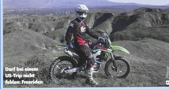
Darf bei einem US-Trip nicht fehlen: Freeriden