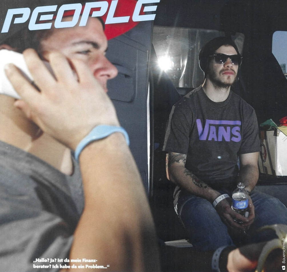
„Hallo? Ja? Ist da mein Finanzberater? Ich habe da ein Problem...“